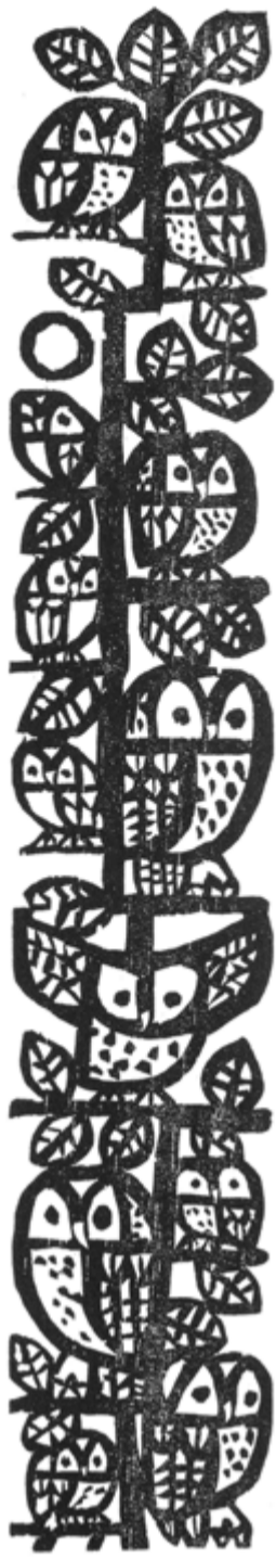
Druck von Celestino Piatti